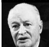
G. Brock Chisholm