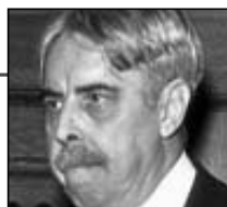
Edward Lee Thorndike

JOHN DEWEY, psykolog och främjare av teorin "människan är ett djur", betecknade kravet att lära barn läsa när de var små för en "perversion", och förespråkade